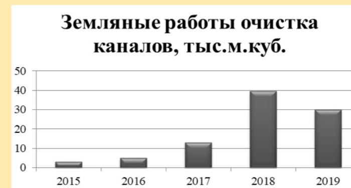
Рис. 2. Объем земляных работ