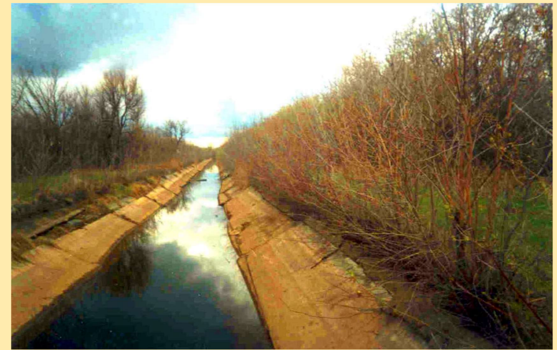
Рис. 1. Заросший участок распределительного оросительного канала