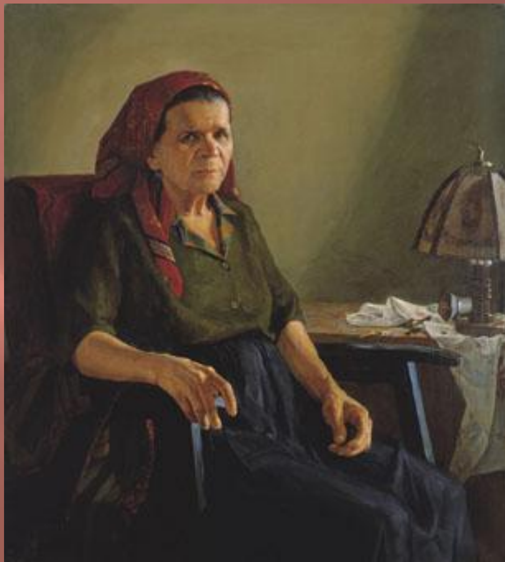
Афони́на Сайда (род. 1965). Портрет мамы. 1990-е г.