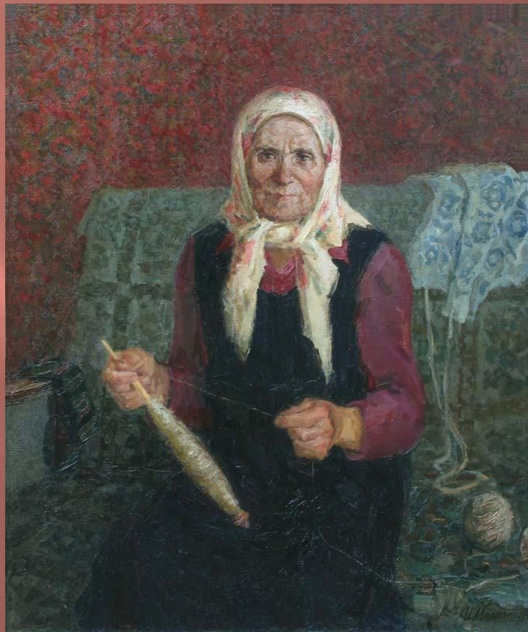
Мамонтов И. Портрет матери. 1979 г.