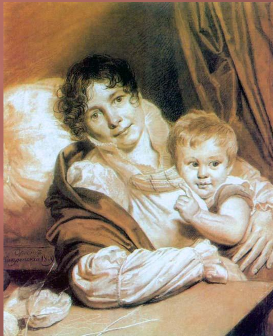
Кипренский О. Мать с ребёнком (Портрет госпожи Прес). 1814