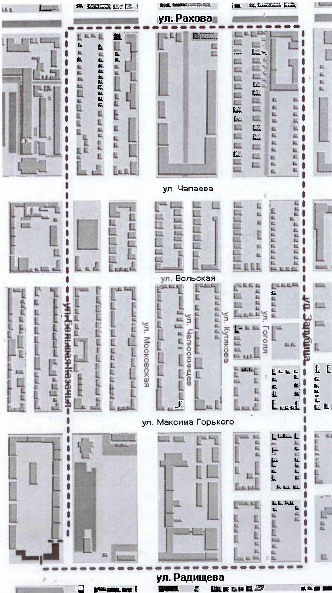
Схема маршрута № 1

УТВЕРЖАЮ Проректор по экономическому развитию и организационной работе А.Н. Мигуванов 09 2015 г.